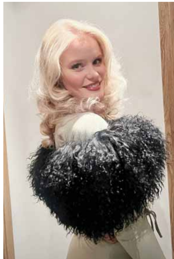
Helgu er margt til lista lagt.