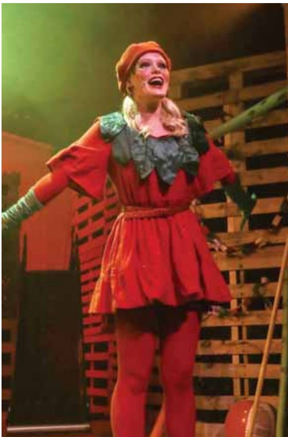
Helga í hlutverki Mæju jarðarbers í Ávaxtakörfunni.