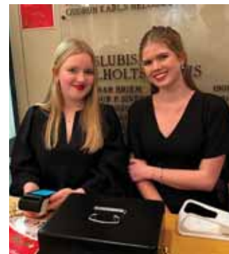
Nemendur í kórstjórn sjá um miðasölu á tónleikum.