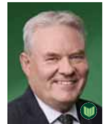
Sigurður Ingi Jóhannsson