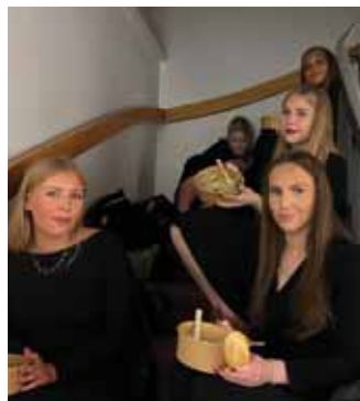
Kórfélagar næra sig á milli tónleika.