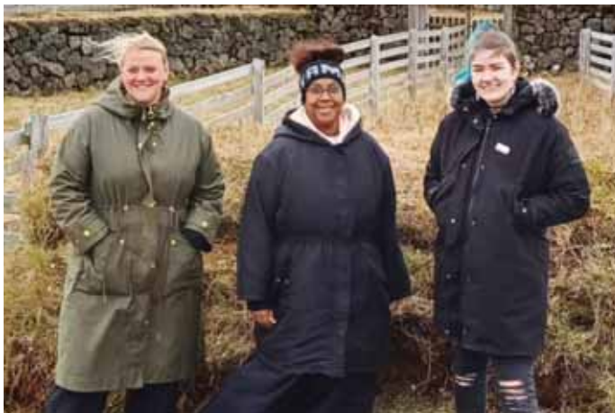
Stjórn Hryllingsfélags Skeiða- og Skelfingarhrepps.

Við vorum með varðeld inni í almenningnum og buðum upp á heitt kakó og sykarpúða til að grilla í eldinum. Einnig var eitt hræðilegt draugahús fyrir lengra komna en það var Félagsmiðstöðin Zero á Flúðum sem sá um það. Selásbyggingar smíðuðu líka völundardraugahús fyrir yngri hetjurnar. Spákona mætti á