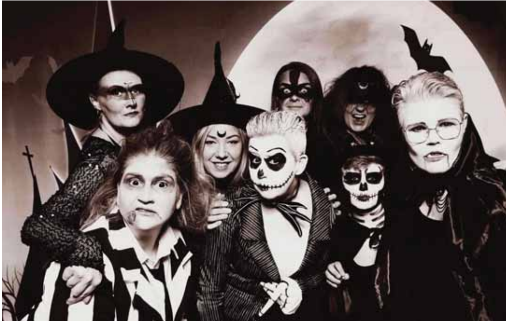
Skipuleggjendur hátíðarinnar samankomnar á Nornþingi. Allt var gert í sjálfboðavinnu.

Pollóween fór fram í Þorlákshöfn 28. október til 2. nóvember. Hátíðin hefur verið mjög vinsæl síðustu ár og þátttaka góð. Viðburðirnir voru margir og eitthvað í boði fyrir