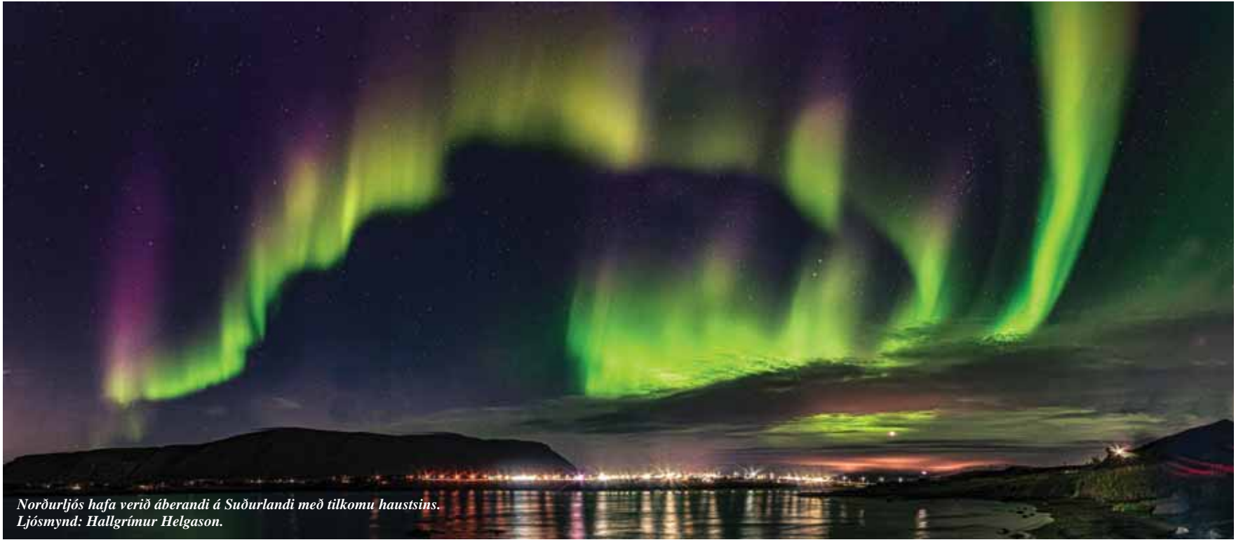
Norðurljós hafa verið áberandi á Suðurlandi með tilkomu haustsins.