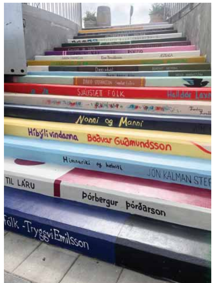
Ljósmynd: Miðbær Selfoss

Áhugasamir geta fylgst með Juans á Instagram-síðunni hans @juanpicturesart. BRV