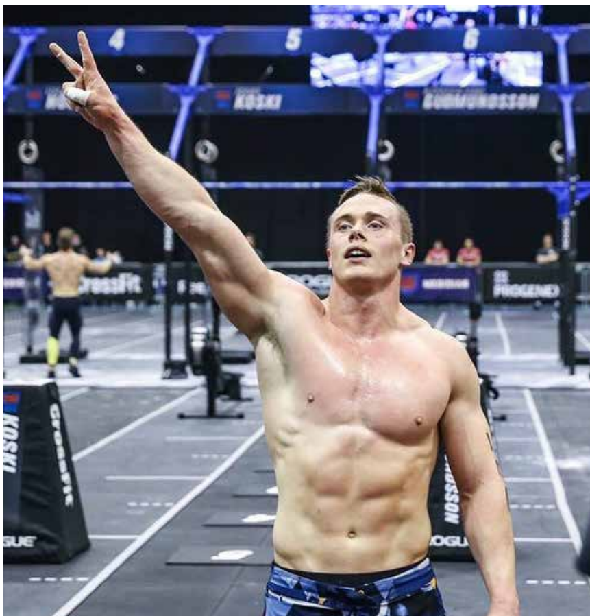
Kominn inn á heimsleikana í annað sinn, árið 2015.

Það sem er einkennandi fyrir CrossFit samfélagið segir Björgvin vera samfélagið sjálf. „Stöðvarnar og fólkið er náttúrulega það sem gerir CrossFit að því sem það er. Fólk tengist einhverjum böndum sem það almennt gerir ekki í annarskonar líkamsrækt. Þú sérð líka fáa eða jafnvel engann í stúkinni, hvort sem það er á Ís-