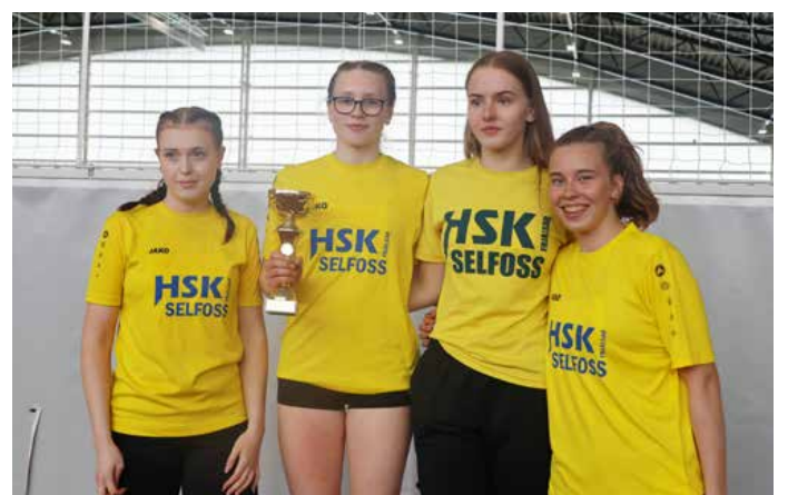
Sigurlið HSK/Selfoss í flokki stúlkna 15 ára