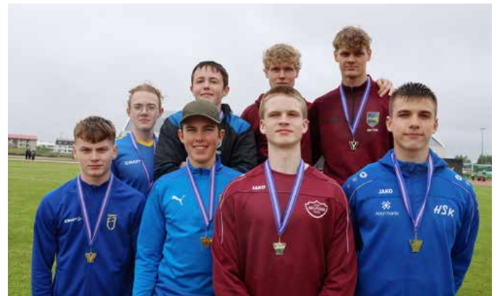
Sigursveit HSK/Selfoss í boðhlaupi 16-17 ára, t.h. á myndinni, setti HSK met í sínum aldursflokki.